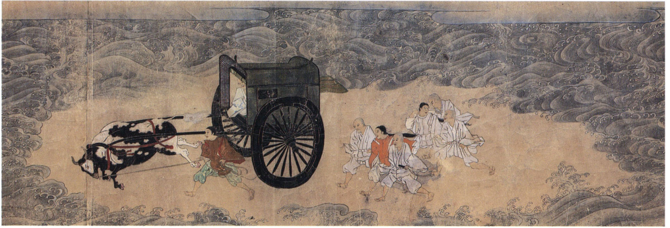
尊意鴨川渡水 〈卷三第七段〉